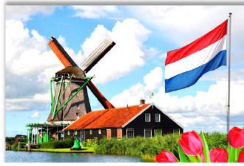
Holanda com seus tradicionais moinhos

fé com fervor. O ano passado foi um período de crescimento notável, onde almas tomaram a decisão de se batizar, simbolizando seu compromisso com o Senhor e a nova vida em Cristo.